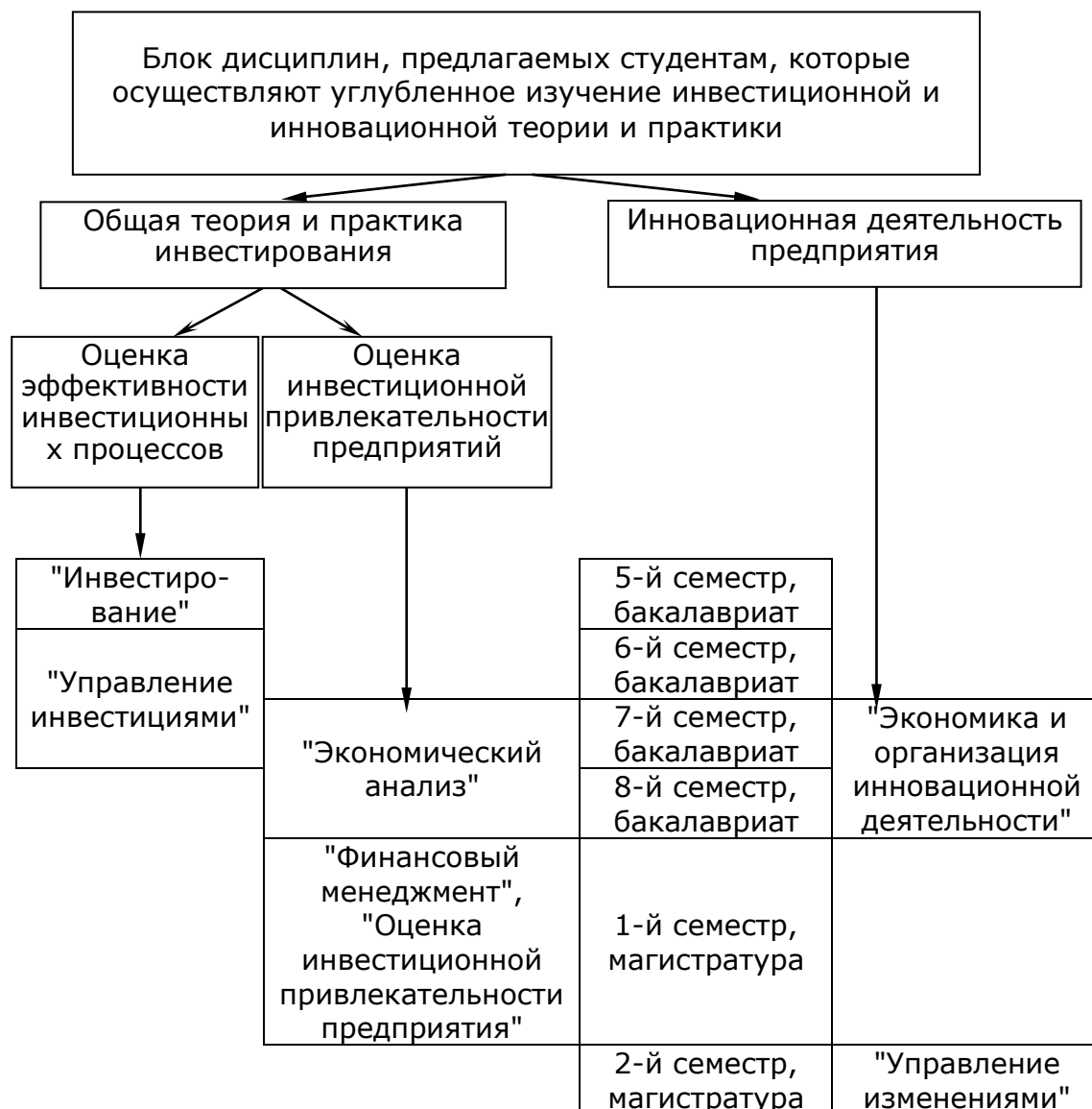
Рисунок 1 – Структурно-логическая схема подготовки студентов по экономике предприятия с углубленным изучением инвестиционной и инновационной теории и практики