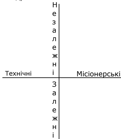
Рисунок 1 – Система координат класифікації “фабрик думок”

На нашу думку, чотирма основними показниками, за якими можна класифікувати ФД є дихотомії технічні-місіонерські та залежні-незалежні. Подібний підхід до класифікації можна представити у вигляді двох осей, що утворюють чотири квадрати.